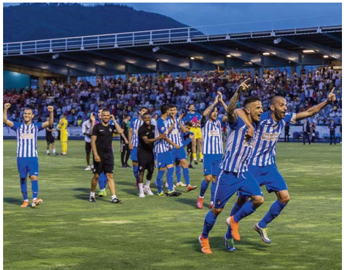
Así festejaron los jugadores de la Ponferradina el pase.