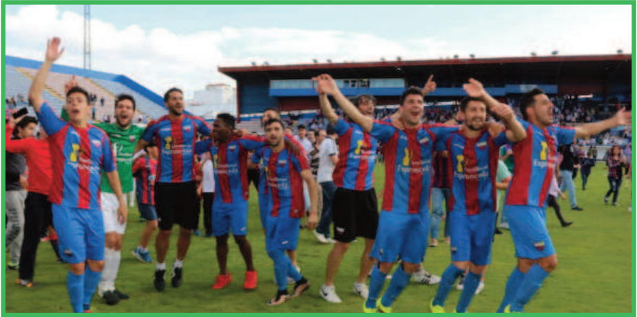
Los jugadores del Extremadura celebrando el ascenso

La temporada pasada fue campeón del grupo XIV, por delante del Badajoz, Arroyo y Jerez. Para ser campeón necesitaron apurar hasta el final ya que solo superaron en 3 puntos al equipo pacense. Sumaron 90 puntos y su delantera logró 106 goles. Solo dos derrotas en el total de la competición.