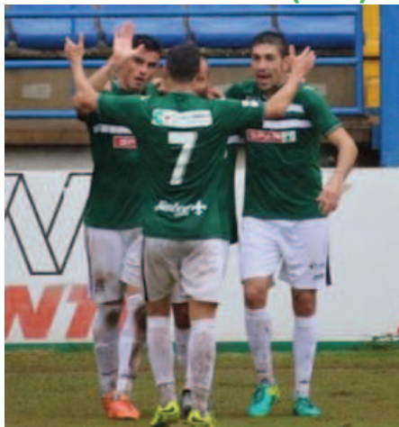
Celebración del 0-2