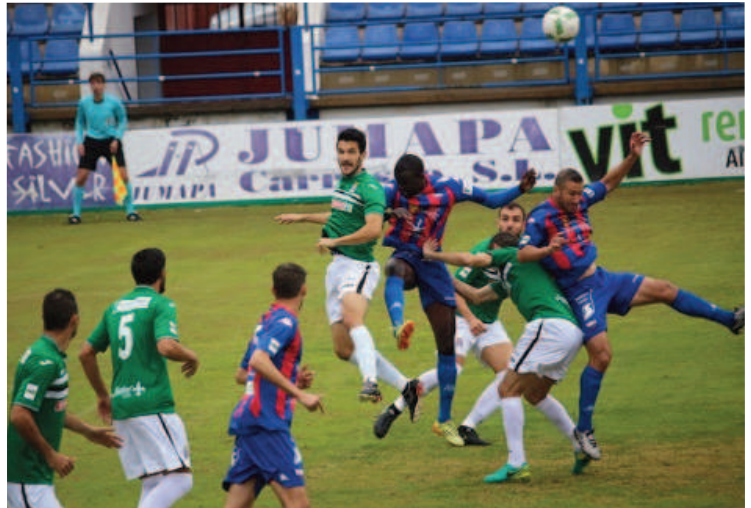
El Cartagena se defendió bien en Almendralejo