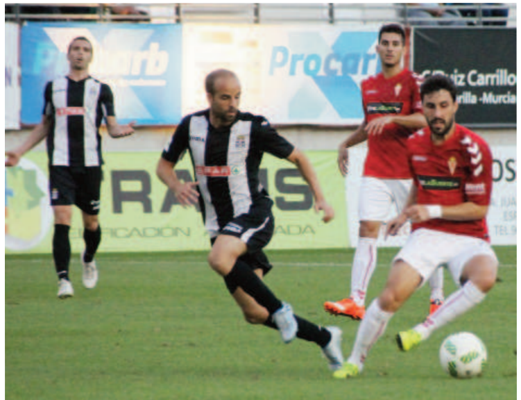
Sergio García la volvió a tener en NC

Jaume (Fuenlabrada), Titi (Logroñés), Cuero (Lorca Deportiva), París y Borjas (Sabadell) y Germán (Cartagena).