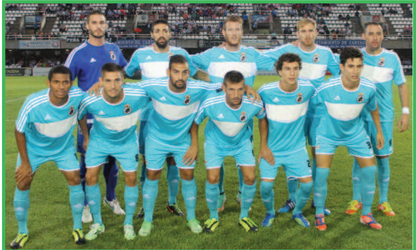
Once del Linense el año pasado en el Estadio / Pablo Caparrós

La Balona acabó la temporada en el puesto undécimo, en zona tranquila y sin agobios para mantener la categoría, pero la primera vuelta del campeonato fue muy malo y llegó a ser colista en la jornada sexta con un solo punto, el que logró en el Cartagonova. Hasta la jornada décimo tercera anduvo en la zona roja y con un solo punto por encima del colista, Betis B. Ello motivó el cambio de técnico y llegó una leve mejoría que le sacó de los puestos de riesgo; aunque al concluir la primera vuelta solo sumaba 20 puntos y estaba a dos de la Promoción de descenso y a tres del Jumilla, que era candidato al descenso en aquellos momentos.