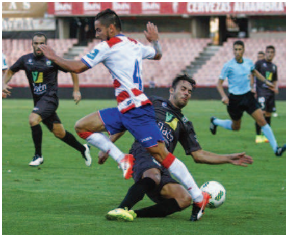
Imagen del debut del Mancha Real en Los Cármenes .