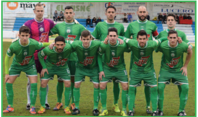
Alineación que logró el ascenso contra el Zamora.