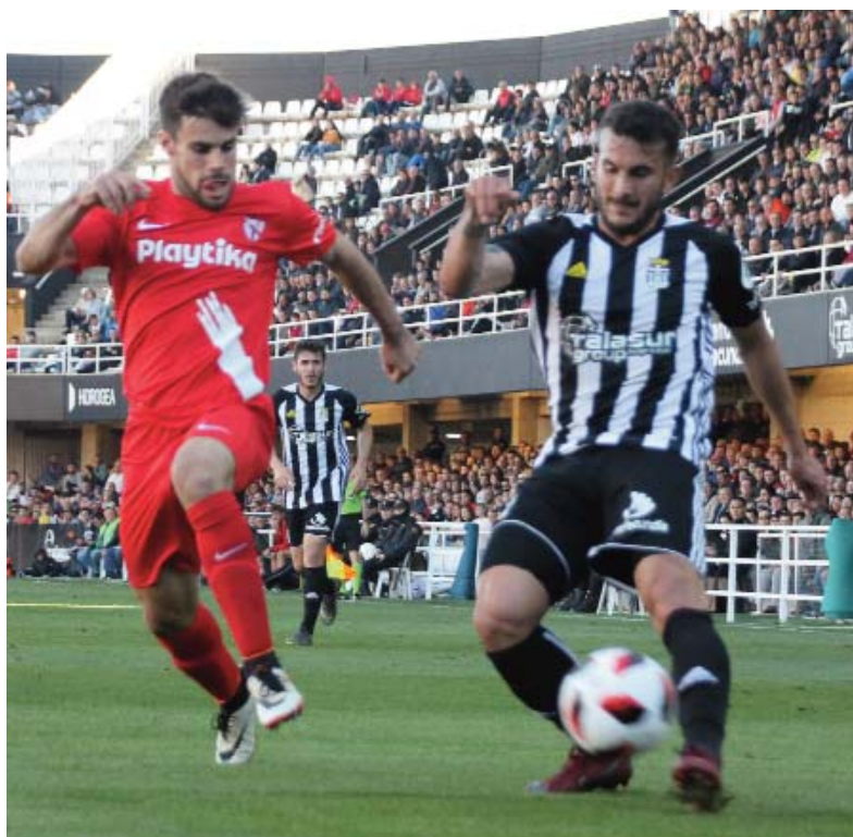
Elady es el gol del Efesé y esta semana descansa

Destaca el dato que los dos delanteros centros no están aportando goles. El vasco solo uno en la segunda vuelta, mientras que el sevillano Rubén Cruz que no cuenta con minutos y solo ha hecho tres goles esta temporada el último en la jornada 14 contra el Ibiza.