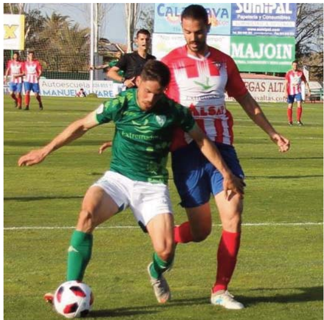
Varapalo in extremis del Villanovense en el derby con el Don Benito