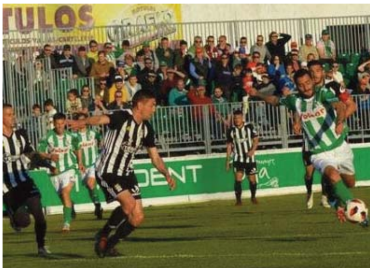
El Efesé “palmó” en El Palmar / diariodejerez.es

Munúa se queda como Monteagudo con trece partidos invicto