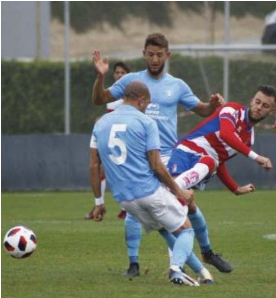
El Ibiza ganó en sus dos últimas salidas.