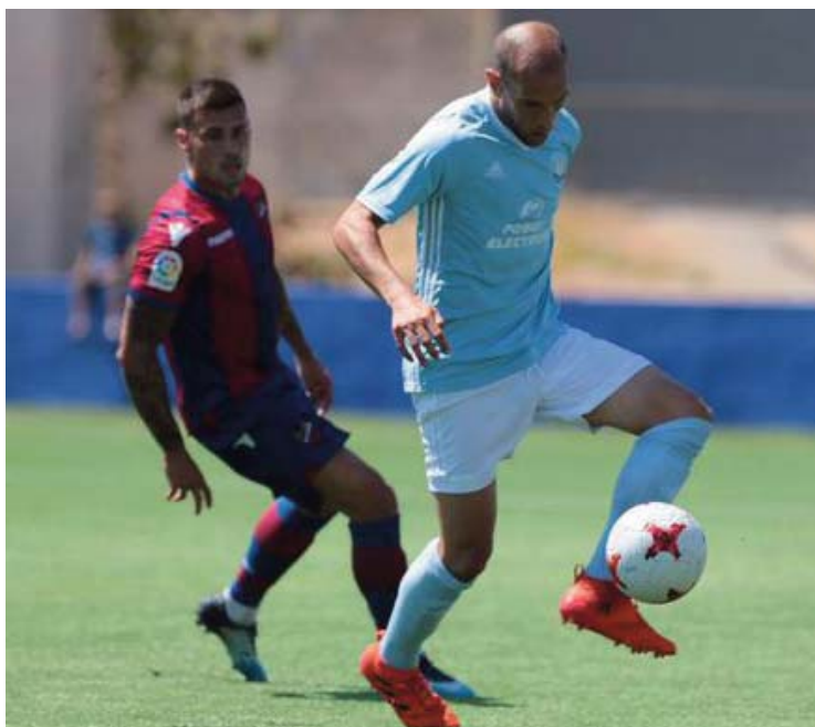
Imagen de la final con el Atlético Levante