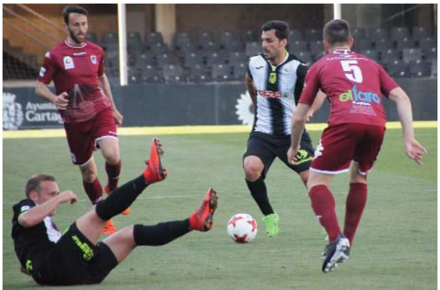
Imagen del partido del año pasado en el Estadio