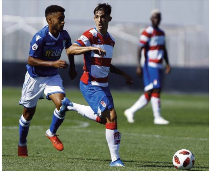
El Recreativo Granada golea y arrebató el liderato al Melilla

Esta temporada con un nuevo proyecto, mantiene la base defensiva de la temporada anterior y es un aspirante a luchar por estar entre los cuatro primeros. En la jornada quinta fue el líder del grupo y ha vuelto a serlo en la séptima. Fuera de casa ha obtenido los tres resultados ganó en Talavera (0-1), empató en San Fernando (0-0) y perdió su imbatibilidad en Granada contra el filial Recreativo (5-1). En casa ganó los cuatro partidos Ejido (1-0), Marbella (2-1), Balompédica Linense (3-1) y Don Benito (3-0). En la Copa del Rey sigue adelante tras eliminar al Yeclano (1-2) y al Tudelano (3-0). Se