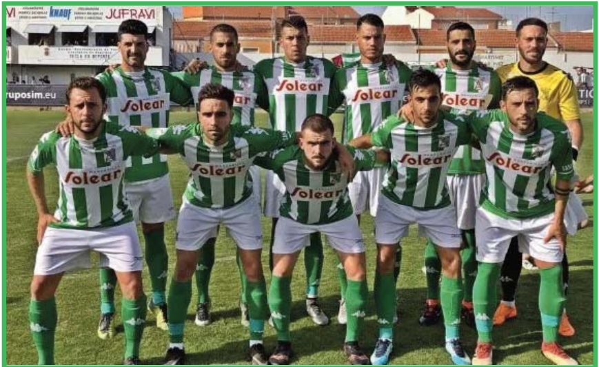
Alineación del Atlético Sanluqueño el día del ascenso en Yecla.