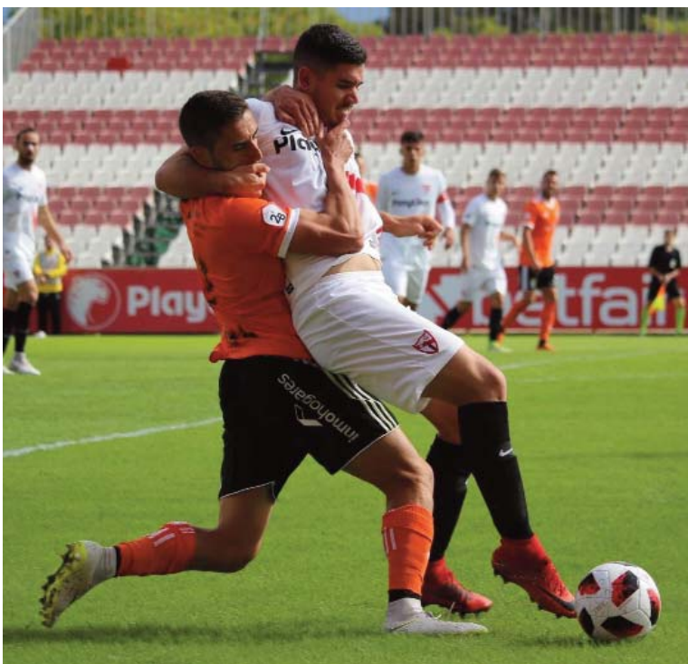
Moyita y defebnsa del Sevilla Atlético se zafan

El Melilla no pudo consolidar su liderato al dejarse los primeros puntos ante el UCAM que es el primer partido que no gana a domicilio. Uno y otro están demostrando ser los mejores en el arranque y a punto de cumplir el primer cuarto del campeonato.