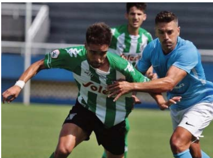
El Sanluqueño ganó en Ibiza.