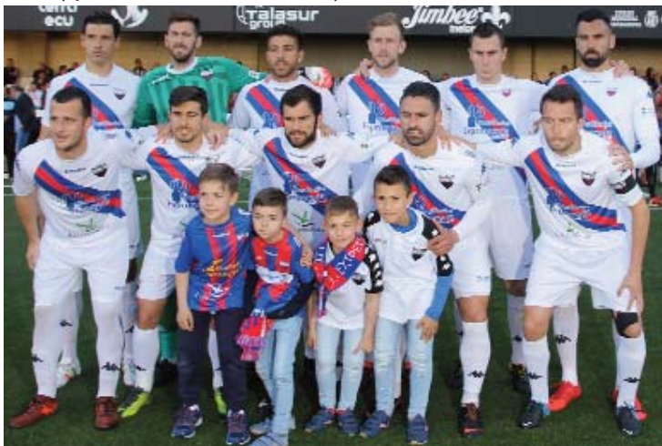
Once del Extremadura esta temporada en el Estadio