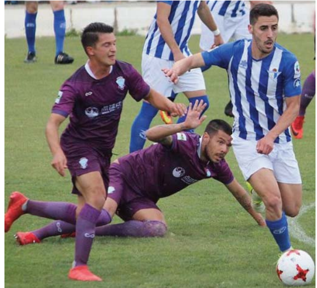
El Jumilla se trajo los puntos de Écija