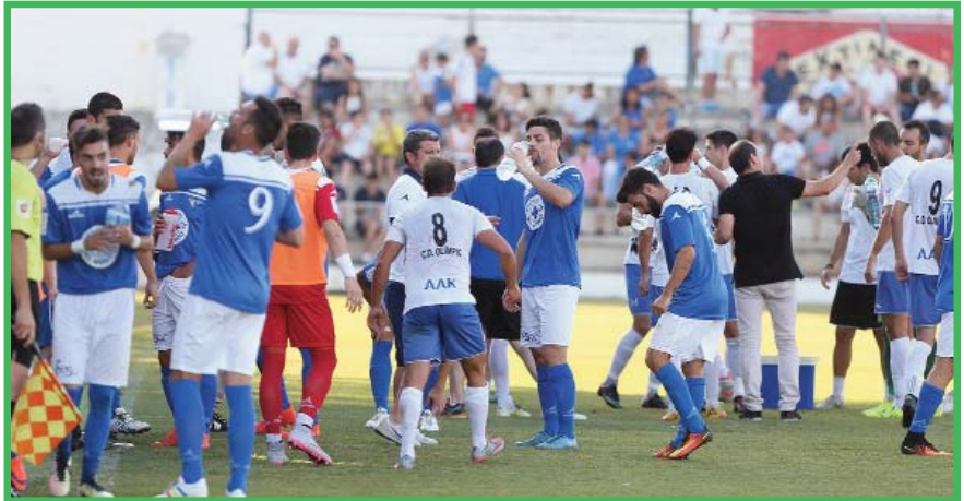
Acabado el partido en La Murta, el ascenso se decidió desde el punto de penalti-