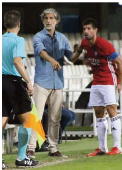
El Mirandés puede tocar

Ya hay dos descendidos, Lorca y Betis, faltan dos plazas y una segura (incluso las dos) es para el Córdoba B o Mérida que se enfrentan entre sí. Y la cuarta, más la Promoción de Permanencia será para el ganador de ese partido, Écija, Jumilla, Badajoz, Balona y Las Palmas Atlético. Por su parte Recreativo de Huelva y Ejido están fuera de peligro. En resumen que salvo el San Fernando-UCAM en los otros nueve partidos de la última jornada hay algo en juego.