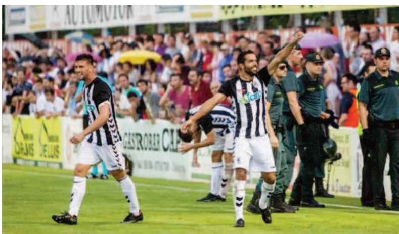
Alegría pacense tras marcar el 1-2 en Calahorra