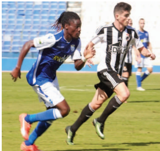
La primera derrota a domicilio fue en Melilla