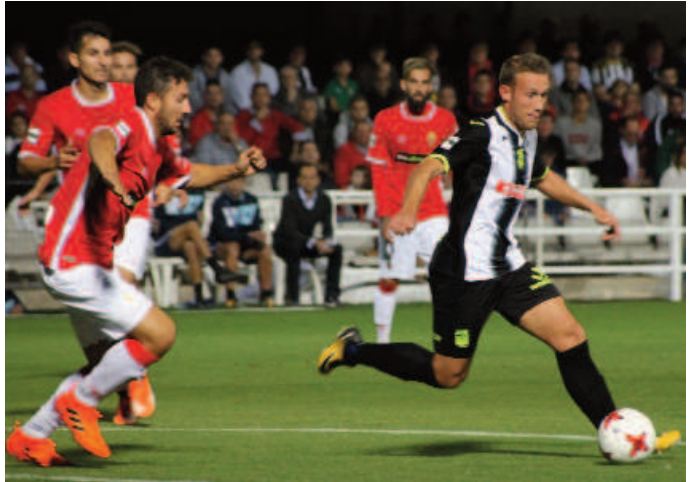
Aketxe marcó cuatro de sus siete goles en los derbis. UCAM (2), Real Murcia (1) y Lorca (1)

GIII: El Mallorca aventaja al Villarreal B en 11 puntos y 14 al Onteniente.