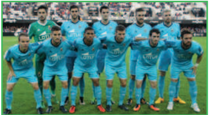
Once del Linense la pasada temporada en el Estadio