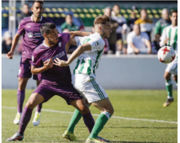
Loren salvó un punto ante el Jumilla

El filial verdiblanco (antiguo Triana) por tradición ha dado mucha guerra en sus visitas al Estadio, no hay más que ver la tabla de resultados históricos. Ha puntuado en la mitad de las visitas y en las otras tres cayó por la mínima. En la temporada 12-13, descendido, privó al Cartagena en la penúltima jornada de ser campeón. Y seguro que este año no será menor su resistencia. Fuera de casa sólo ha sumado dos empates, en ambos casos sin goles y contra otros dos filiales, Córdoba B y Las Palmas At. Perdió en el resto, Huelva y Villanovense (1-0), San Fernando (2-0), Balona (4-1) y Melilla (4-0).