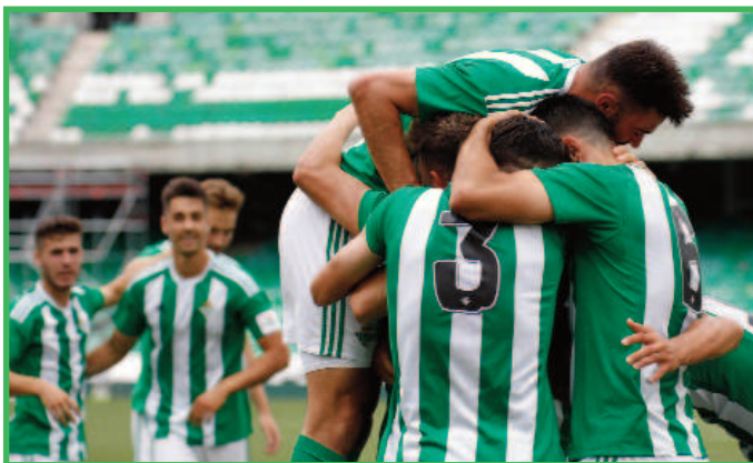
Tras el gol la alegría de los jugadores verdiblanco.