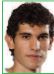
VALLEJO Real Madrid