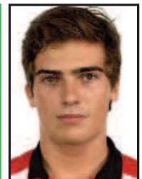
CÓRDOBA Athletic Club