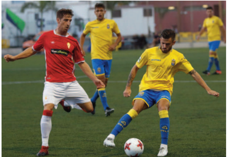
La única victoria a domicilio del Real Murcia fue ante Las Palmas At.