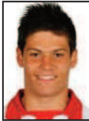
MERÉ FC Koln