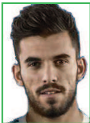
CEBALLOS Real Madrid