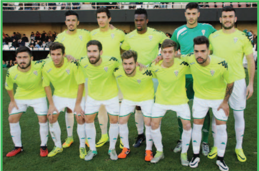
Once del Córdoba B en el Estadio la temporada pasada

Al terminar la temporada dejaron el club Marc Vito (Extremadura), Pedro Luis (Melilla), Valera (Huesca), Raúl Garrido (Buñol), Moha (Cádiz), Fran Serrano, Pablo Vázquez y J.A. González (Granada B), Samuel (Lucena), Vera (Real Jaén), Brian (Roda), Roser (San Roque Lepe), Quiles (UCAM) y Leto (Zaragoza B).