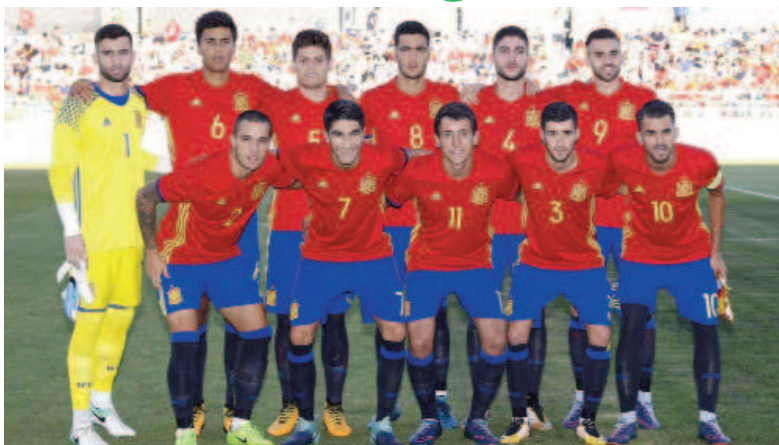
Alineación que presentó España en Tallín.

El Estadio Municipal Cartagonova será de nuevo escenario de un partido de la selección de España Sub-21, conocida como la rojita. Será el 14 de noviembre frente a Eslovaquia jugará y cinco días antes en el Estadio de la Nueva Condomina ante Islandia. Los dos, partidos correspondientes a la tercera y cuarta jornada del Grupo 2 de la Fase de Clasificación para el Campeonato de Europa Sub-21 de Italia y San Marino 2019. Antes del doble compromiso en noviembre en Murcia y Cartagena, la Sub-21, con los primeros tres puntos conseguidos en Tallín frente a Estonia (0-1) en el primer partido de clasificación, se medirá como visitante a Eslovaquia en octubre.