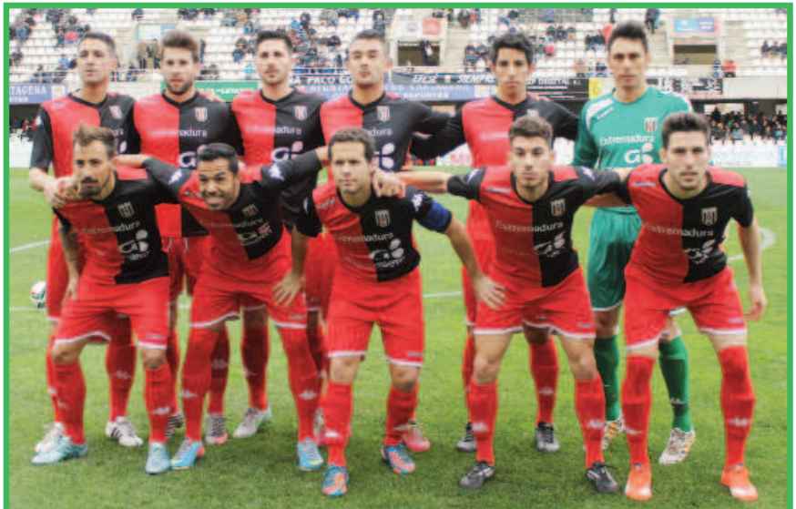
Once que representó el Mérida la pasada temporada en el Estadio