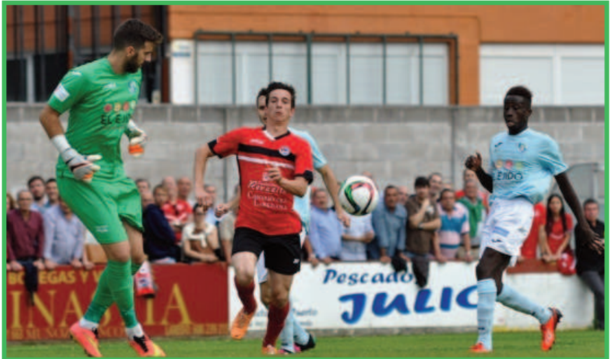
El Ejido defendió el gol marcado en el choque de ida para eliminar al Laredo.

En la ronda decisiva les correspondía el campeón cántabro, Laredo. Un gol de Alfonso en la ida bastó para lograr el ascenso, porque en el San Lorenzo no hubo goles. De esta manera consumaban el ascenso y devolvían a localidad fútbol de Segunda B, tras la desaparición del Poli Ejido.