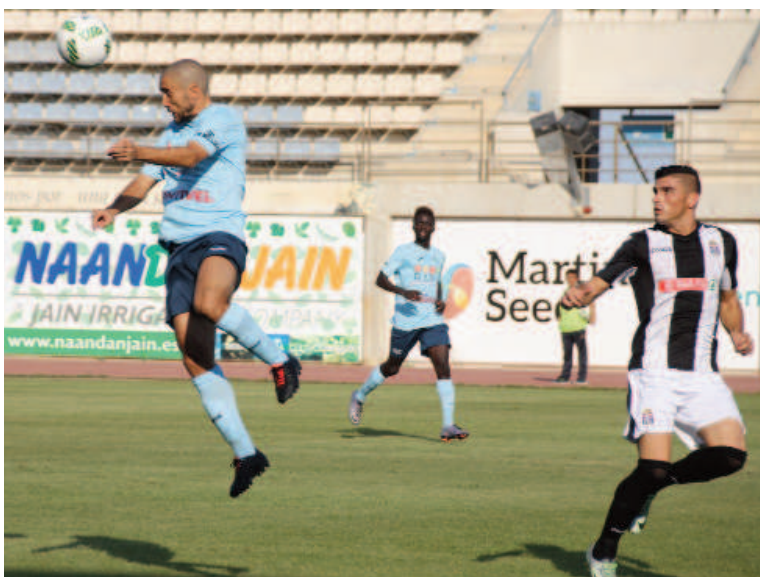
La defensa del El Ejido no dio opciones