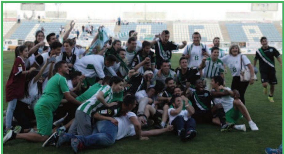
Celebración en el césped del Artés Carrasco tras lograr el ascenso.