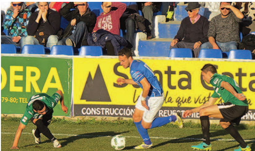
El Cartagena arañó un punto en Linarejos

El equipo leonés llevaba 18 jornadas invicto y tras perder contra el filial del Osasuna (2-1) doblaba de nuevo la rodilla en Tudela y ahora vez como por detrás se le aproxima el Rácing de Santander, que con 44 puntos está a solo dos de los leoneses.