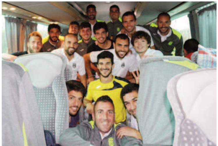
Los jugadores en el autobús satisfechos con la victoria en Extremadura.