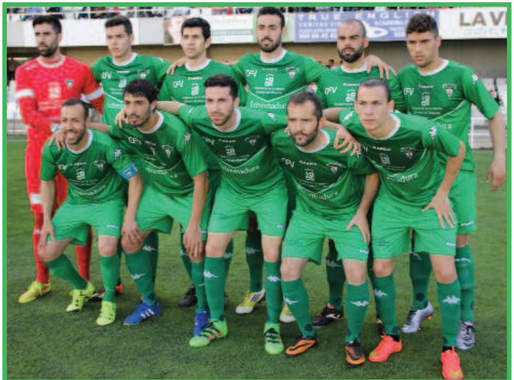
Once del Villanovense en el Estadio